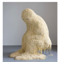
Théo Mercier, le solitaire , 2010

Exploiter la littérature de jeunesse sur le thème des peurs et des monstres, les contes, etc...ci dessous une bibliographie