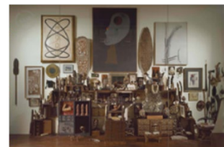
André Breton, photographies de son Mur d'atelier, 1922-1966

Peter Fischli et David Weiss, sculptures avec des objets du quotidien : Construire des assemblages ou produire des modelages pour recherche la verticalité et expérimenter l'équilibre, la chute (objets, kaplas, jeux de construction) Créer une installation pour occuper un espace avec des objets (selon des contraintes)